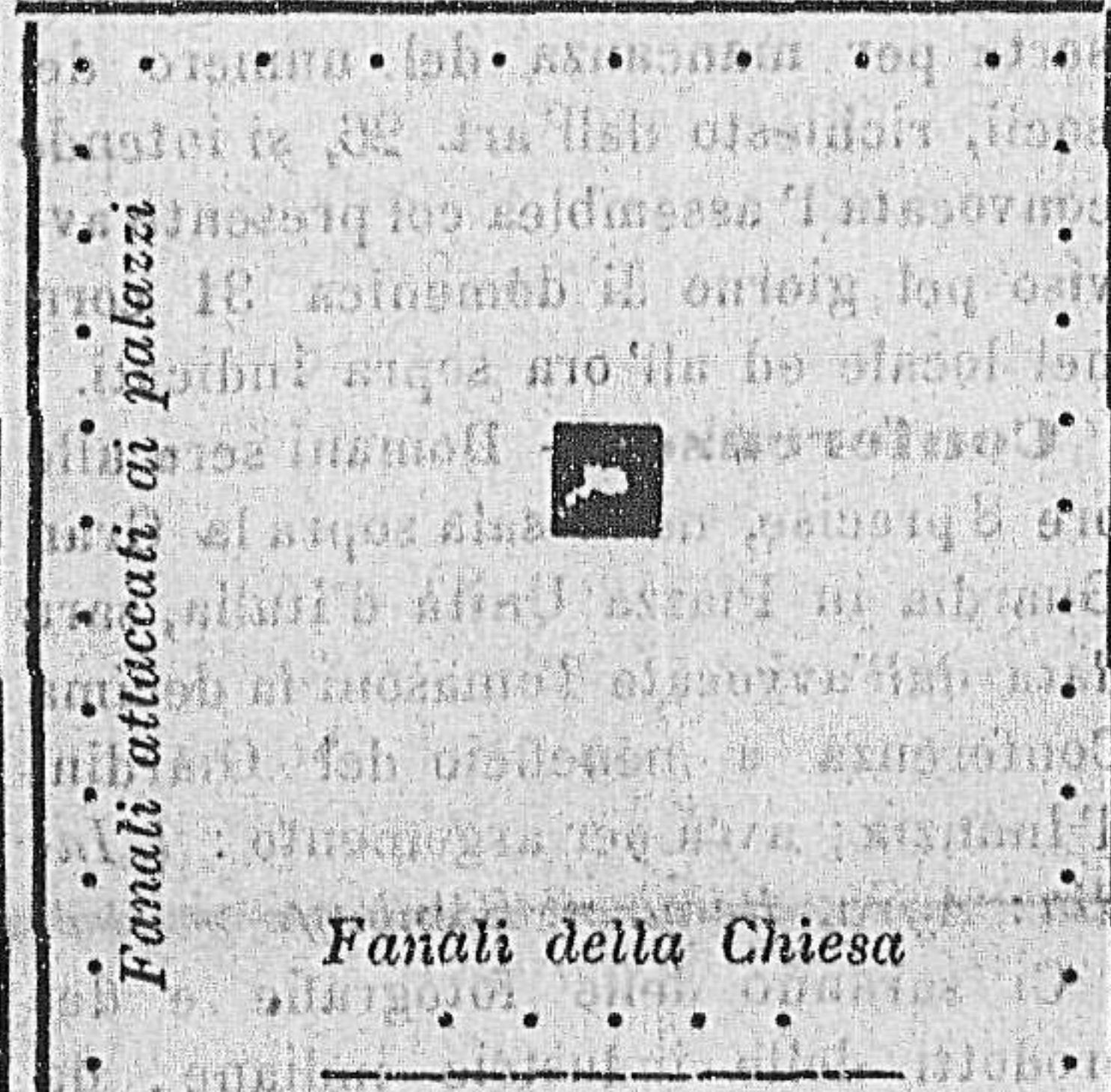
Illuminazione com'era prima del 1877

Nel bel mezzo della Piazza non si possono leggere i Debats. In compenso si può impunemente baciare l'amorosa o altra donna che sia.