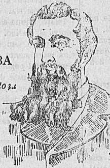
DOPO LA CURA