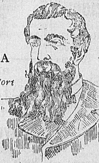
DOPO LA CURA