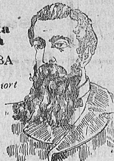
DOPO LA CURA 900